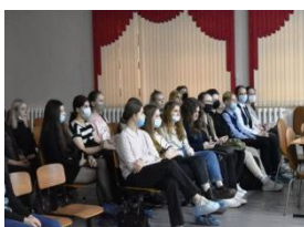
«Медицина для каждого»